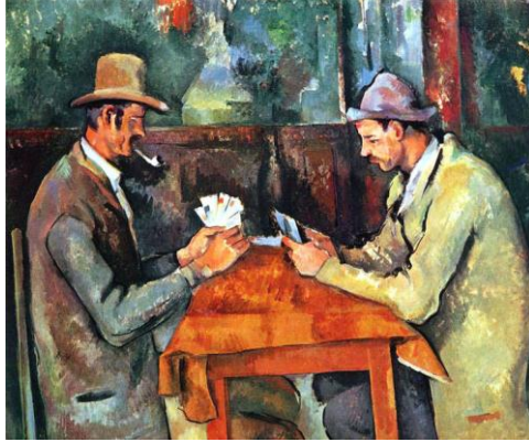
fig. 5 – Paul Cézanne, Os Jogadores de Cartas, óleo s/ tela, 1892-1895