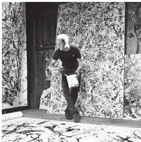
fig. 6 – Hans Namuth, fotografia de Jackson Pollock, 1950