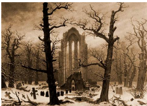
Fig. 4 - Pintura de Gaspar Friedrich

(50 pontos) 2 - Os pintores do Romantismo utilizaram a natureza como meio para expressarem o seu estado anímico, construindo um paisagismo cheio de símbolos e interpretações subjectivas. Que fizeram os pintores Realistas em oposição a estes ideais? Justifique a sua resposta.