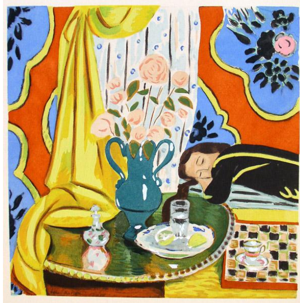
Fig. 6 - Henri Matisse, Harmonia em Amarelo , óleo s/ tela, 88x88 cm