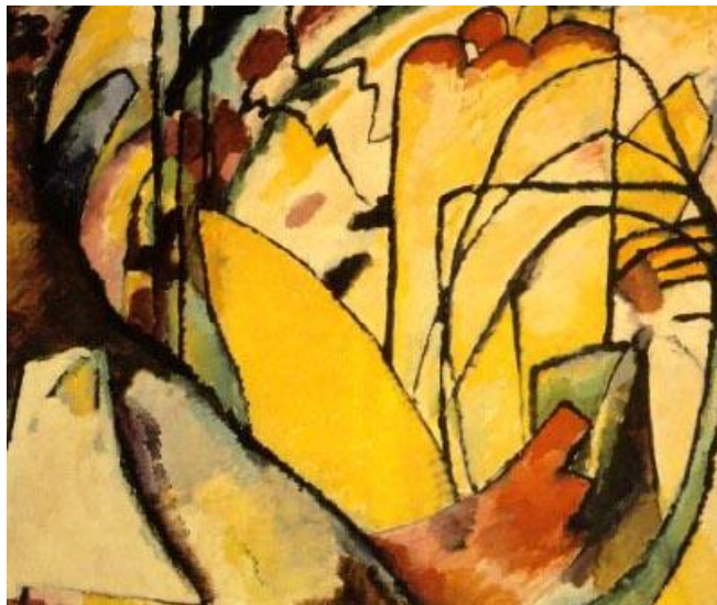
Fig. 7 - Wassily Kandinsky, Improvisação X , 1910, óleo s/tela, 120 x 140 cm