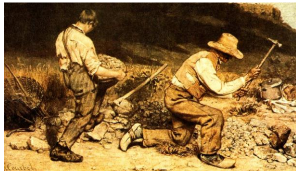
Fig. 5 - Pintura de Gustav Courbet, 1848

(50 pontos) 3 – “Contudo, a integridade e a sinceridade desta arte arquitectónica – que, atentai, o trabalhador cria no que produz, não apenas porque tem que o fazer, mas porque gosta de o fazer, embora frequentemente não tenha consciência desse prazer -, a autenticidade desta arte arquitectónica, requer que os artigos sejam produzidos segundo métodos artesanais, para serem utilizados por pessoas que percebam a perícia artesanal. No trabalho feito nestas condições há e deve haver um intercâmbio nas ocupações da vida. O conhecimento das carências humanas e a consciência da boa vontade dos homens está presente em todo esse trabalho e o mundo interliga-se através dele”.