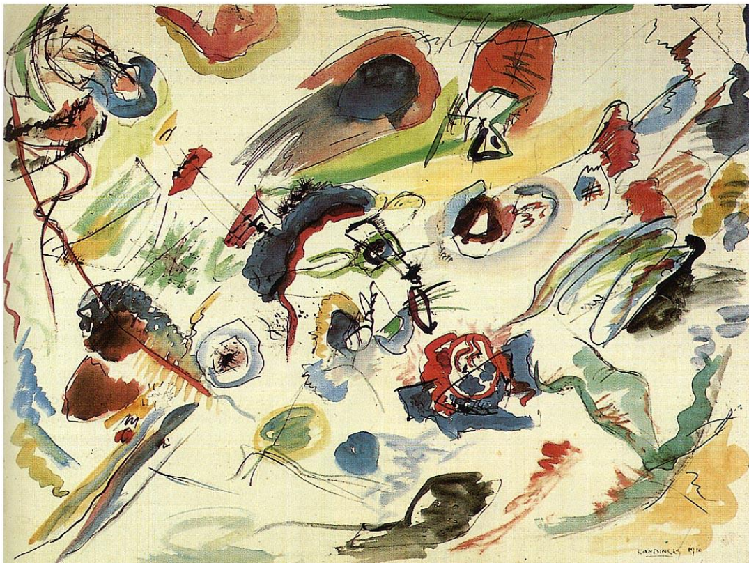
Kandinsky, sem título , aguarela, 1910

Partindo da referência a estas duas obras, caracterize o significado do Abstraccionismo para a História da Arte.