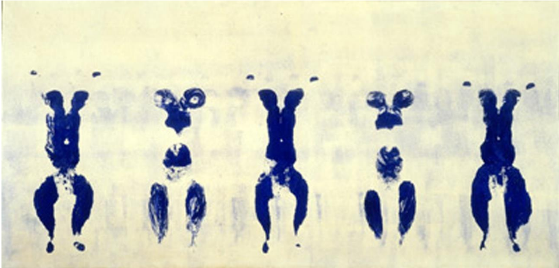
Fig. 2 – Yves Klein, Antropometrias , acrílico s/ tela, 1962.