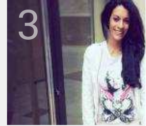
Jovem desaparecida é procurada em Portugal