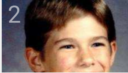
Restos mortais de criança encontrados 27 anos após desaparecimento