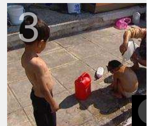
Repórter TVI: "Indesejados"