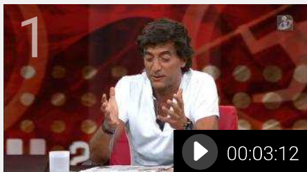
«As palavras de Jesus são um elogio ao Benfica»