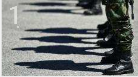
Militar morre em exercício no curso de Comandos