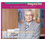
Setembro 2014 | nº 66 (2178 downloads)