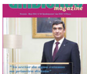
Maio 2014 | nº 65 (2206 downloads)