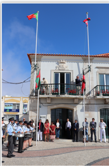
Hastear das bandeiras no edifício dos Paços do Concelho