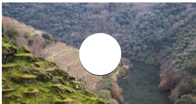
A afirmação da sustentabilidade na Fladgate Partnership