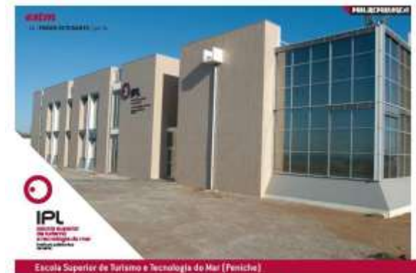
Escola Superior de Turismo e Tecnologia do Mar (Peniche)

GIRE - Gabinete de Imagem e Relações com o Exterior