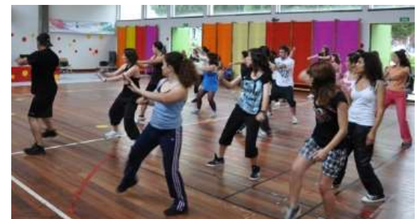
Aula de dança