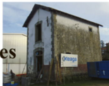
Antiga estação de caminho-de-ferro de São Vicente de Lafões vai ganhar nova vida