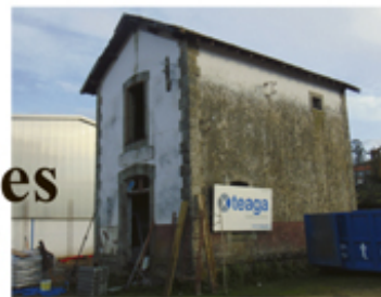
Antiga estação de caminho-de-ferro de São Vicente de Lafões vai ganhar nova vida