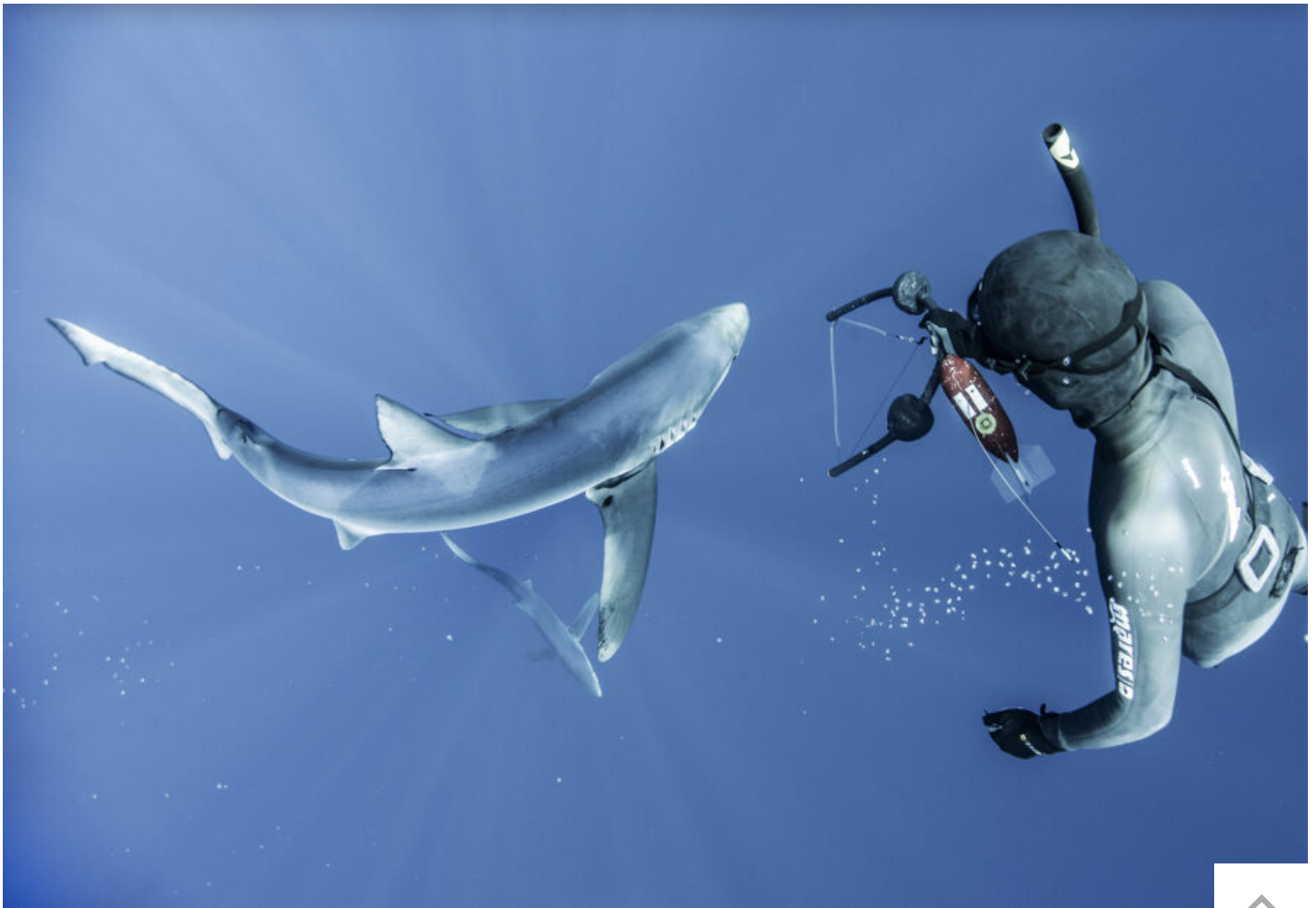
Foto: "Azorean Blues" descreve um projeto piloto de investigação sobre os movimentos de