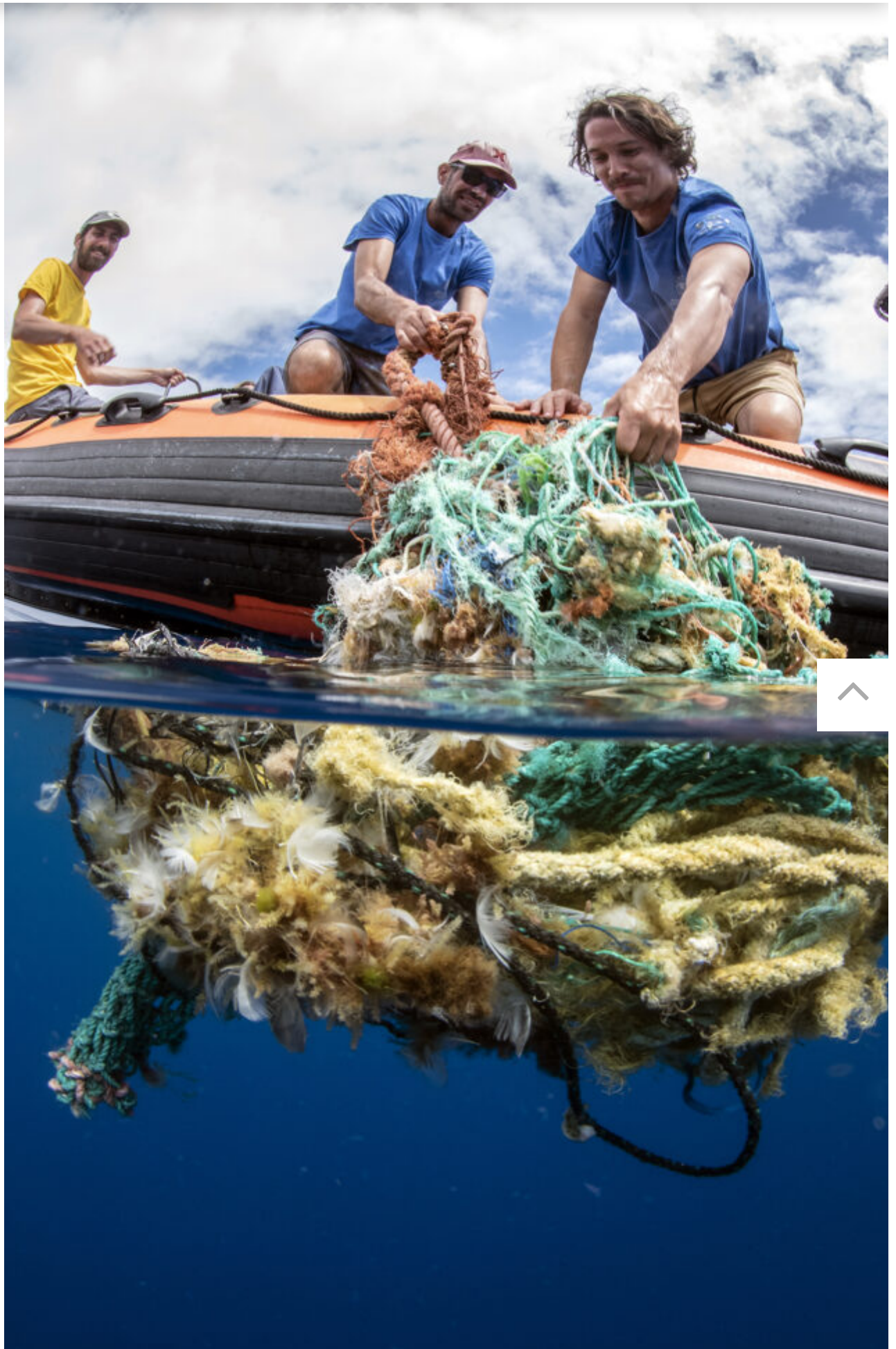
“All hands on deck” foi tirada na ilha do Dico e ilustra investigadores da IT