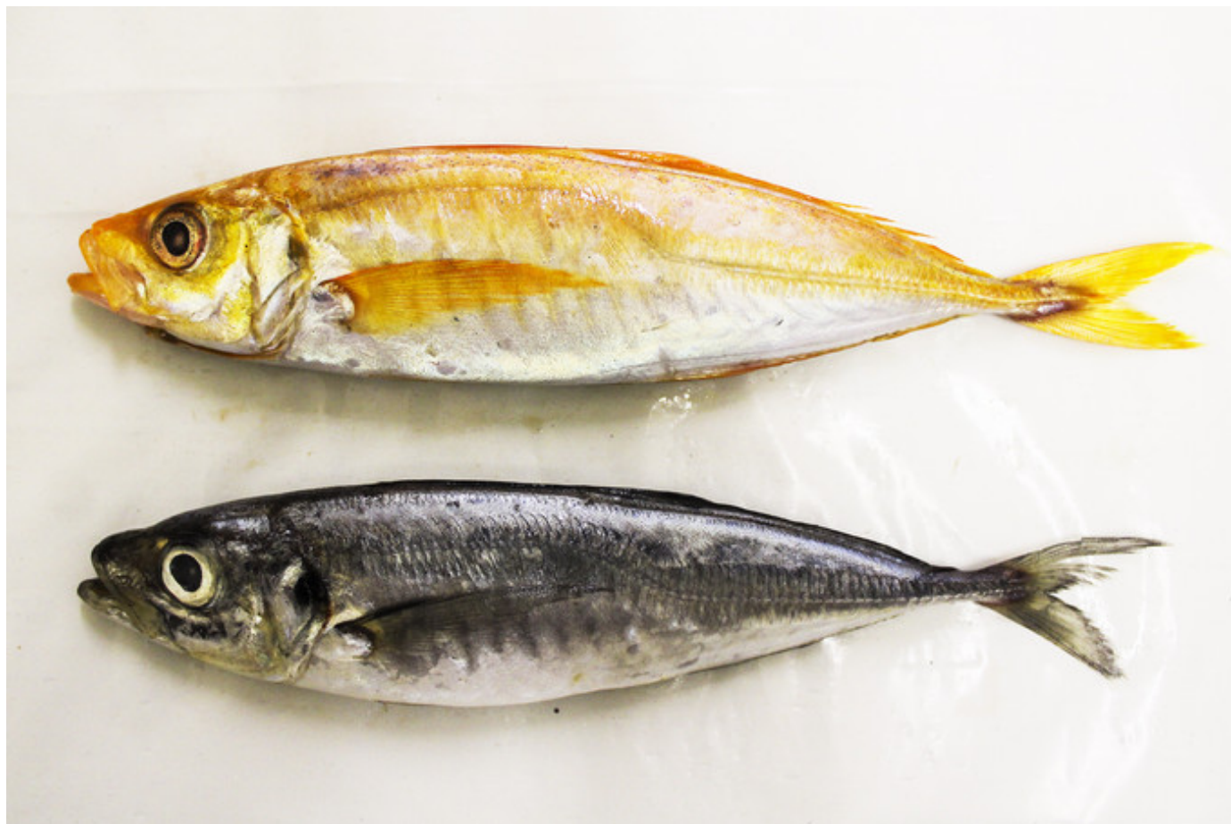
NUNO VASCO RODRIGUES

Neste caso, o dorso do carapau é todo alaranjado, sendo por isso um caso de xantismo total.