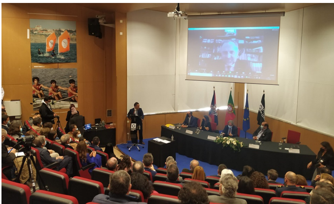
Imagem da sessão de tomada de posse que se realizou hoje, em Peniche.