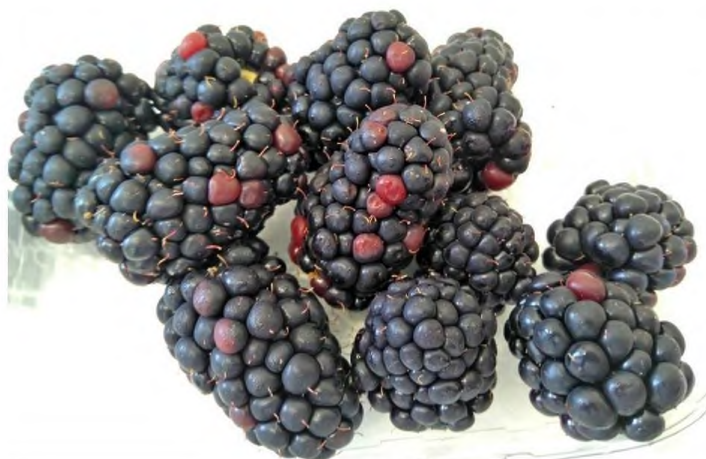
Amoras silvestres para o Projeto PAS

O principal objetivo do projeto foi elaborar uma proposta inovadora na gama dos patés e cremes de barrar com uma formulação de paté adicionado com frutos