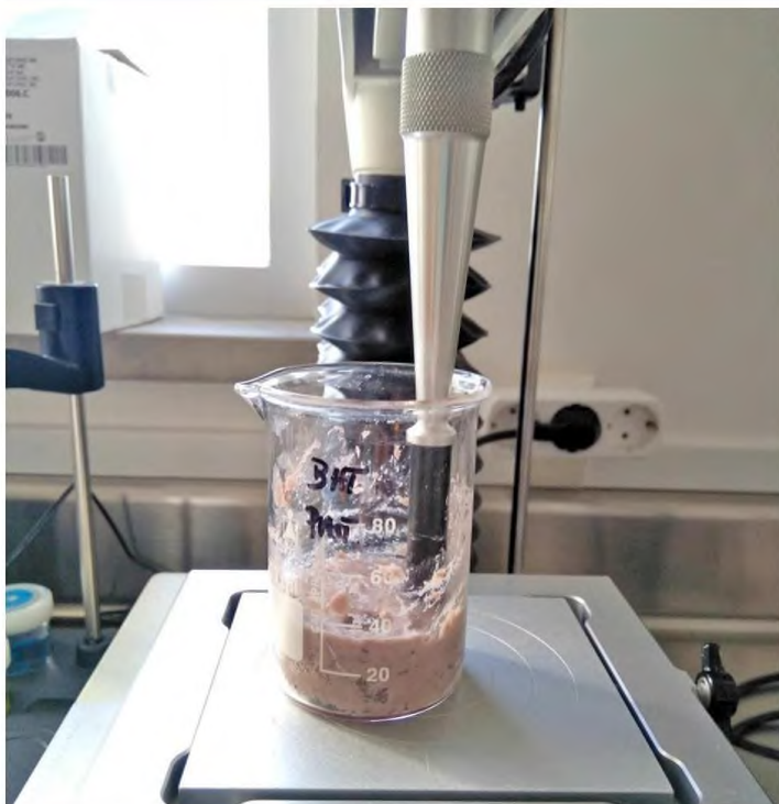
Produção do paté de percebe com amora silvestre

vermelhos (amora silvestre), ricos em antioxidantes naturais. Propõe-se assim ao consumidor um alimento com carácter funcional, contribuindo para o seu bem-estar e melhorando a sua saúde, bem como gerar condições para a emergência de novas empresas direccionadas aos recursos da pesca na região Oeste.