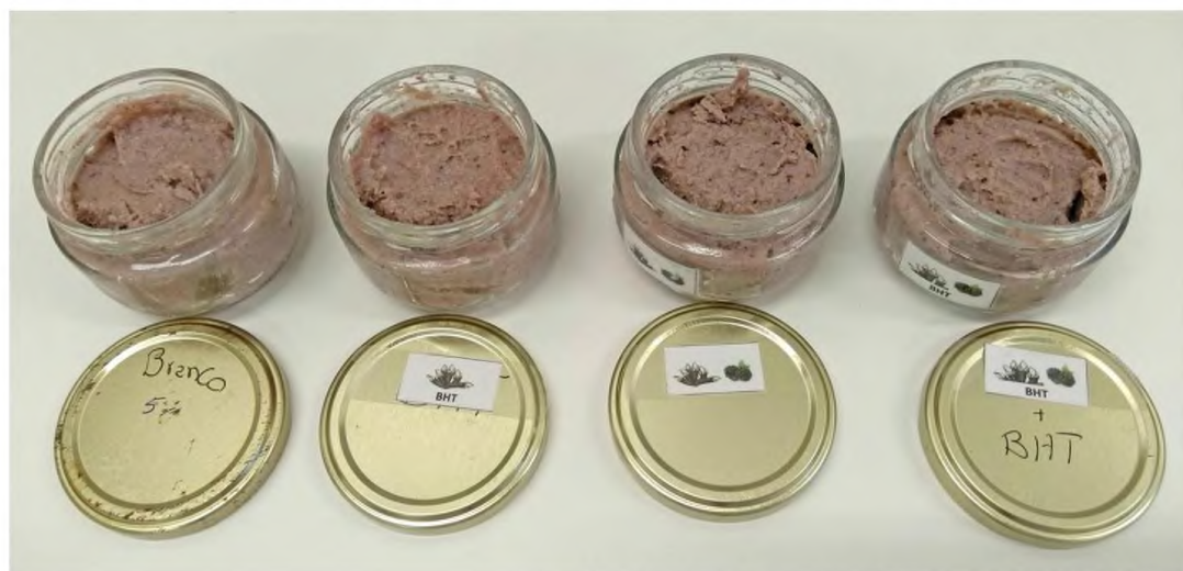
Formulação ótima do paté de percebe, enriquecido com amora silvestre

O projeto obteve o cofinanciamento do Programa Operacional Mar 2020, Portugal 2020 e Fundo Europeu dos Assuntos Marítimos e das Pescas.