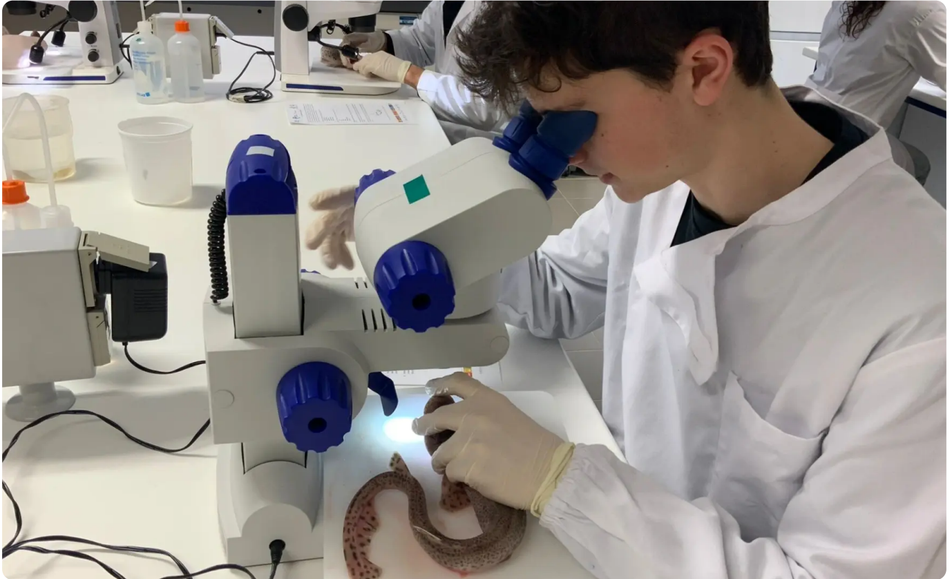
Ocean Open Day @IPLeiria