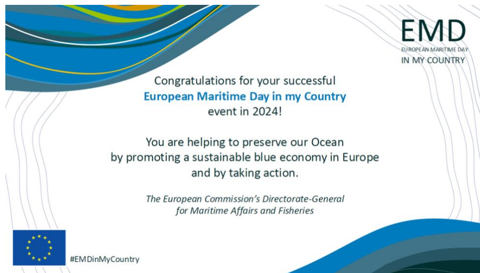
Figura 7 – Certificação obtida pelas atividades desenvolvidas no ano de 2024

público, em particular os jovens. O objetivo é que as comunidades compreendam que as atividades no mar (turismo costeiro, pesca, vela, transporte marítimo, energia renovável offshore, aquacultura, etc.) são essenciais para os cidadãos e para as economias da União Europeia (EU).