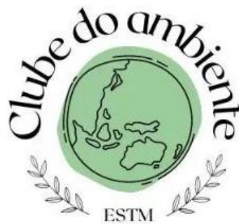
Figura 11- Clube do Ambiente da ESTM - Politécnico de Leiria

A ESTM - Politécnico de Leiria irá manter o compromisso institucional para a implementação de ações que contribuam para dar resposta aos ODS, reforçar a formação completa dos seus estudantes e sensibilizar toda a comunidade académica para a necessidade de adoção de comportamentos e medidas relacionadas com a sustentabilidade ambiental, social e económica. Neste sentido, e com o objetivo de promover comportamentos mais assertivos nesta temática, a Direção da ESTM - Politécnico de Leiria, dará continuidade à disponibilização de ecopontos destinados à reciclagem de papel, plástico, vidro, pilhas, medicamentos, cápsulas de café e canetas/marcadores. Todos os contentores serão estrategicamente colocados em vários pontos do Edifício Pedagógico, em articulação com o Clube do Ambiente da ESTM - Politécnico de Leiria (Figura 11) e com o apoio de vários elementos da comunidade. De salientar que esta é uma atividade enquadrada no plano de ação do programa Eco-Escolas da ESTM - Politécnico de Leiria.