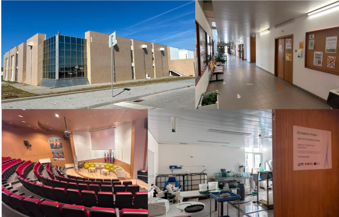
Figura 9 – Espaços intervencionados na ESTM - Politécnico de Leiria no âmbito do projeto Skills for Future.

Adicionalmente, com o objetivo de valorizar o Edifício Pedagógico da ESTM – Politécnico de Leiria e de proporcionar melhores condições de vivência e usufruto do Campus 4, terá início a criação de novos espaços verdes na sua área envolvente, incluindo a zona circundante ao edifício dos Serviços de Ação Social (SAS) do Instituto Politécnico de Leiria, que também será alvo de intervenção (Figura 10).