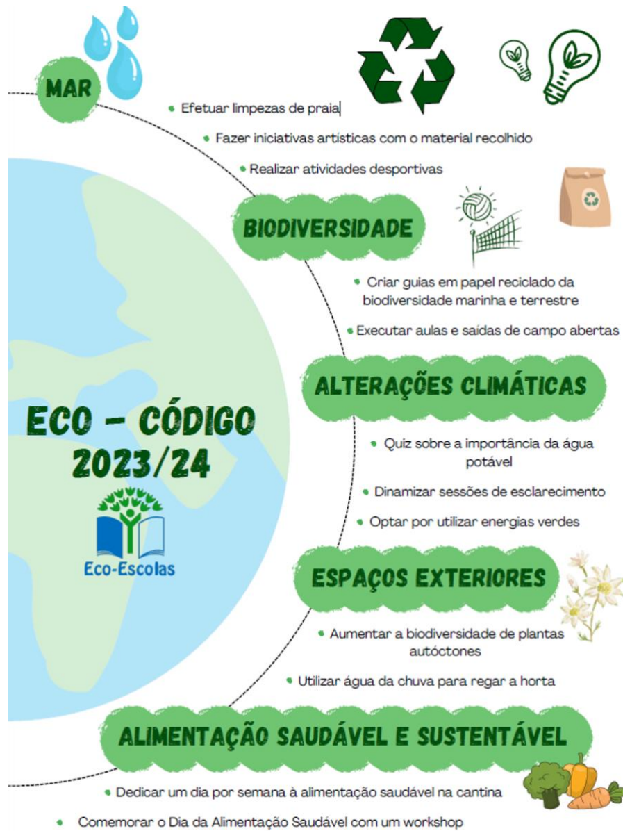
Figura 12 - Eco-Código 2024 da ESTM - Politécnico de Leiria

O estímulo, a valorização e a visibilidade da produção científica e da capacidade científico-pedagógica são fatores-chave numa IES. Por outro lado, uma IES aberta e global tem de integrar os desafios sociais, privilegiando a partilha de conhecimento e assumindo uma vontade inequívoca de responder a problemas que são preocupações para a sociedade, como preconizado pela Agenda 2030 das Nações Unidas.