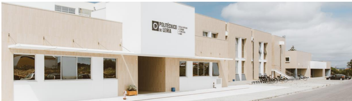
Figura 1 - Entrada Principal da ESTM - Politécnico de Leiria

A ESTM – Politécnico de Leiria (Figura 1), enquanto estabelecimento de ensino superior público, realiza atividades nos domínios do ensino, da formação profissional, da investigação e da prestação de serviços à comunidade, regendo-se por padrões de qualidade que assegurem resposta adequada às necessidades da região e do país em que se insere.