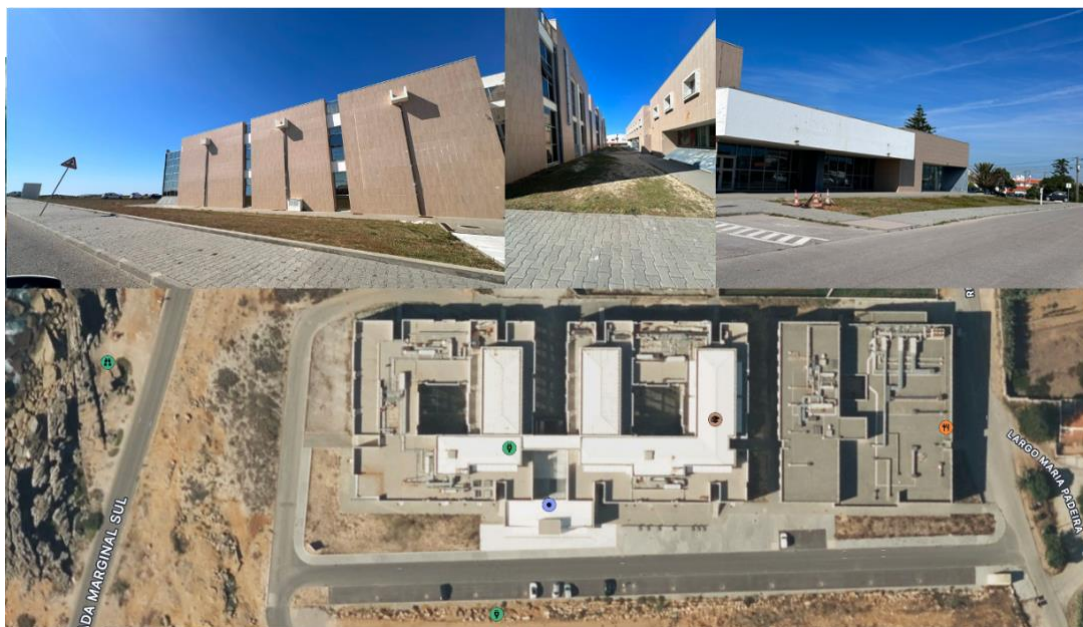
Figura 10 – Área exterior e envolvente ao edifício pedagógico da ESTM - Politécnico de Leiria

Adicionalmente, com o objetivo de valorizar o Edifício Pedagógico da ESTM – Politécnico de Leiria e de proporcionar melhores condições de vivência e usufruto do Campus 4, terá início a criação de novos espaços verdes na sua área envolvente, incluindo a zona circundante ao edifício dos Serviços de Ação Social (SAS) do Instituto Politécnico de Leiria, que também será alvo de intervenção (Figura 10).