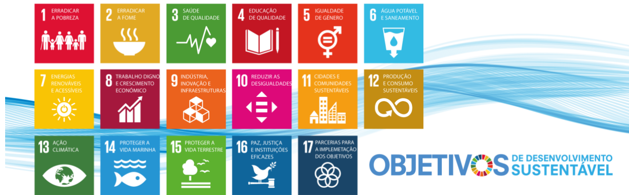
Figura 2 - Objetivos de Desenvolvimento Sustentável

( https://unescoportugal.mne.gov.pt/pt/temas/objetivos-de-desenvolvimento-sustentavel )