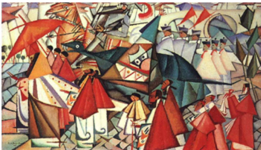
Fig. 2. Procissão Corpus Christi. Autor, Amadeu de Sousa-Cardoso. Data: 1913. Dim. 30x50 cm.

1.2. Contextualize a obra pictórica de Amadeu de Sousa Cardoso no panorama da arte portuguesa modernista. Identifique algumas das características do trabalho do artista na obra aqui reproduzida (fig.2) e explique a relação entre cubismo e futurismo na obra deste pintor. [50 pontos]