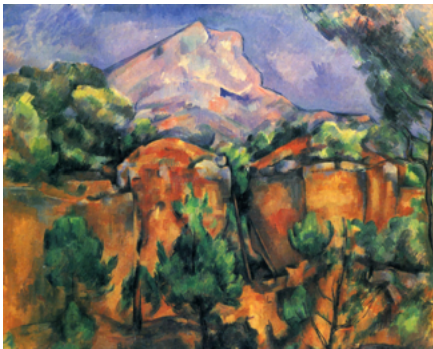
Fig. 1. Mont Sainte-Victoire. Autor, Paul Cézanne. Data: 1897.

1.1. Caracterize o movimento impressionista. Explique como pode relacionar a obra de Paul Cézanne com esse movimento artístico. Elabore um comentário à afirmação “Cézanne é um inovador.” que contemple a análise do quadro reproduzido (fig.1). [50 pontos]