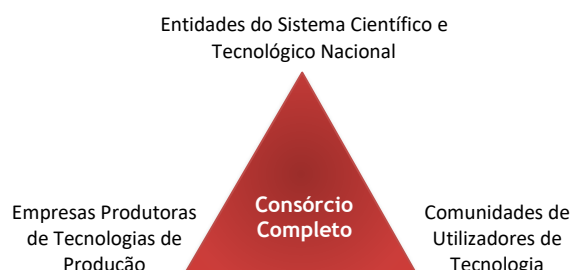
Figura 2 – Triângulo Virtuoso da Inovação Tecnológica